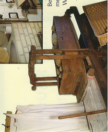
Besonderes Augenmerk verdienen eine Wäscherolle aus dem 19. Jh., die Sommermaschine und ein Backofen.