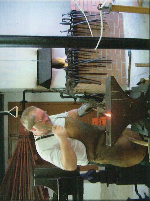
Sehenswert ist die Schauschmiede mit den funktionstüchtigen Einrichtungen und Maschinen.