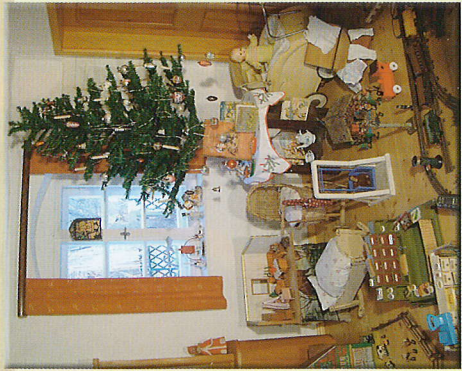
Interessant für unsere kleinen Besucher ist das Weihnachtszimmer.