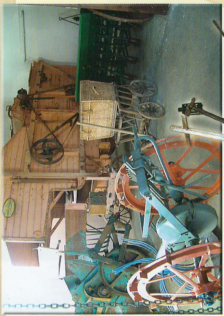
Es gibt auch Werkzeuge und Maschinen zur Feld- und Hofarbeit zu entdecken.