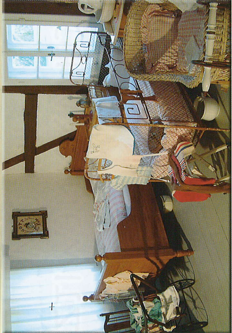
In einem mittelbäuerlichen Dreiseitenhof zeugen Ausstellungen mit 3000 Exponaten von Arbeits- und Lebensbedingungen im ländlichen Gewerbe sowie Handwerk und Imkerei.