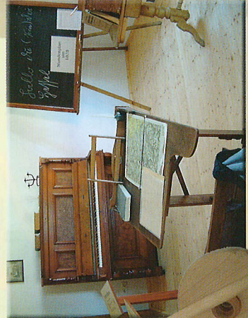
Im Seitengebäude präsentieren sich wechselnde Sonderausstellungen, zum Beispiel zu Omas Schulzeit oder zur Ortsgeschichte.