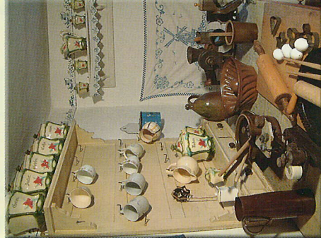
In den mit viel Liebe zum Detail eingerichteten Zimmern findet der Besucher Geräte, Hausrat, Kleidung und Wäsche vor.